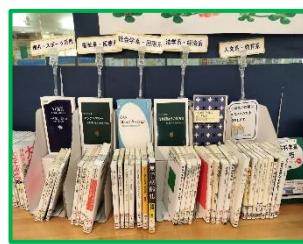
小論文対策におすすめ