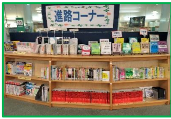
赤本が揃っています