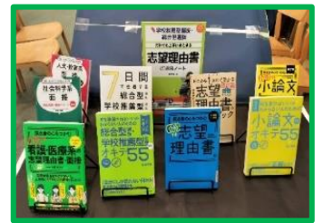
面接 志望理由書対策