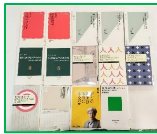
学部 学科に迷った時におすすめ