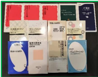
新着の小論文対策本